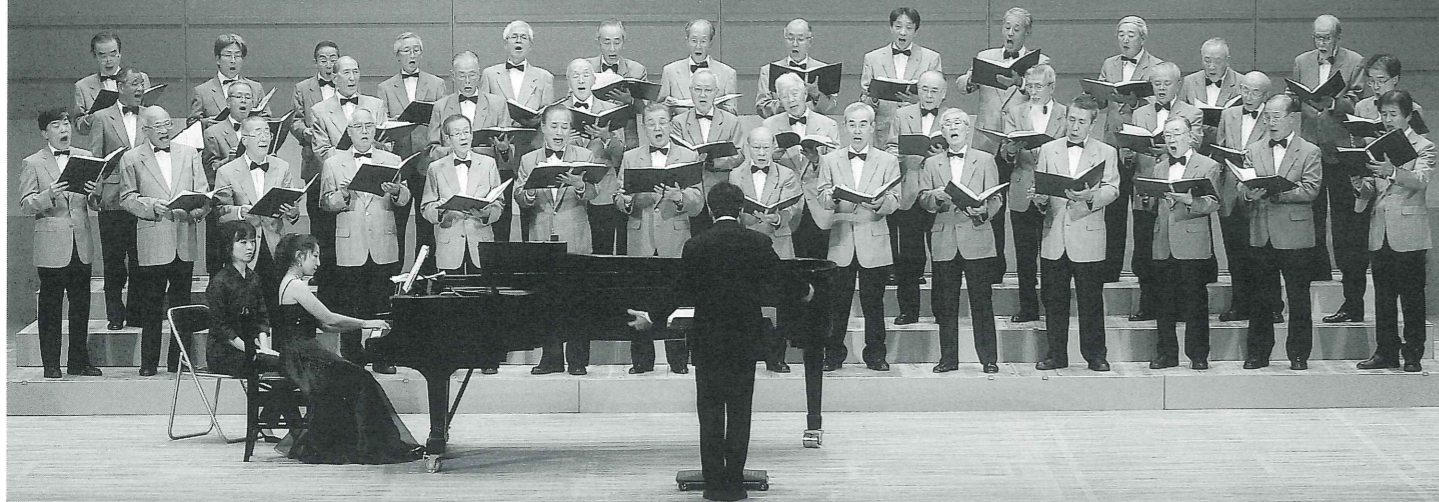
設立70周年記念 第17回南濤会合唱団演奏会 於 大阪国際交流センター 2010.11.14