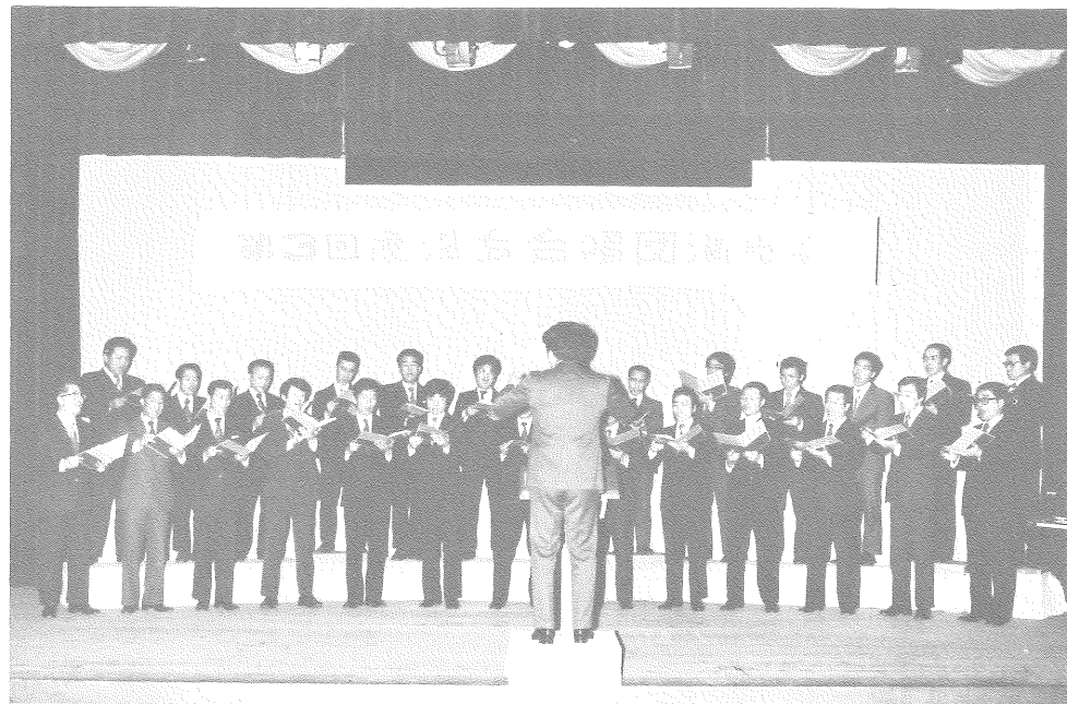
1980. 3. 8 北御堂ホール

どうか、最後までごゆっくりとお楽しみくださいますようお願い申し上げます。ごあいさつといたします。