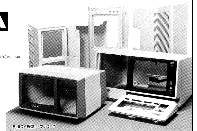
各種OA機器ハウジング

東プラグループ 東洋樹脂株式会社 群馬県太田市 竜舞プラスチック株式会社 群馬県太田市